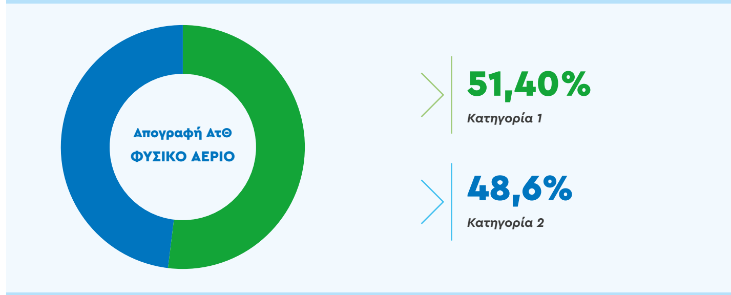
Διάγραμμα: Συμμετοχή κάθε Κατηγορίας εκπομπών στις συνολικές εκπομπές ΑτΘ (Κατηγορίες 1 & 2) για το έτος αναφοράς 2022

Σημειώνεται ότι, το 2022 η εταιρεία δεν διέθετε ηλεκτροκίνητα οχήματα και συνεπώς οι εκπομπές της κατανάλωσης ηλεκτρικής ενέργειας από φόρτιση τέτοιων οχημάτων είναι μηδενικές. Το σύνολο των εκπομπών που υπάγονται στην κατηγορία αυτή προκύπτει λαμβάνοντας υπόψη τα δεδομένα δραστηριότητας που αναφέρονται στην προμηθευόμενη ηλεκτρική ενέργεια και τον αντίστοιχο συντελεστή εκπομπής (emission factor), που αναφέρεται στο ενεργειακό μίγμα για την Ελλάδα (location-based).