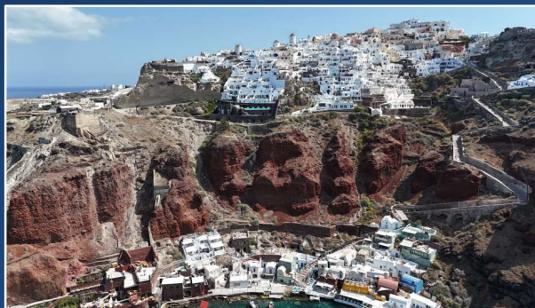
Οία - Περιοχή Αρμένης