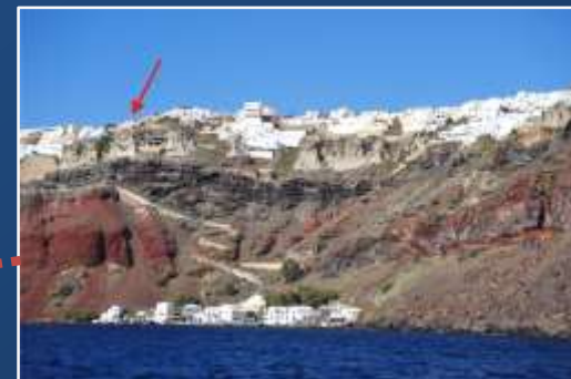
Παλιός Λιμένας – Τελεφερικ Φηροστεφани.