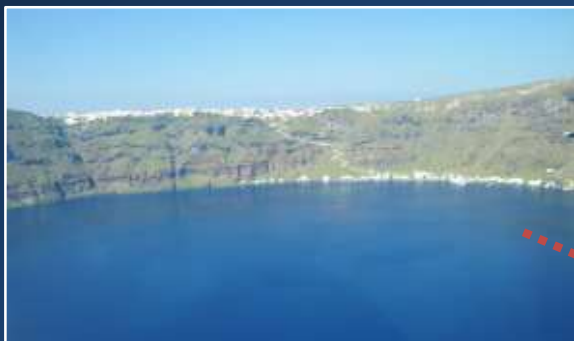
Λιμάνι Αθηνιού και οδικό δίκτυο Όρμου Αθηνιού